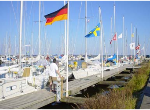
Dragør Sejlklub var vært for International Ballad Cup i 2004.

I vinteren 2003 begyndte medlemmer af Dragør Sejlklub at stå på ski sammen, nærmere betegnet i Wagrain i Østrig.