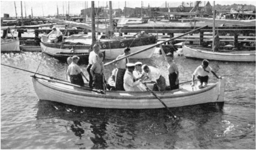
D.S.s første øvelsesbåd "Tove".

problemer også dengang var om foråret. Under krigen fik man således påbud om at fjerne roret fra bådene, som stod på land, og kunne dette ikke lade sig gøre f. eks. på kutterne med fast ror, skulle rorpinden skrues af og fjernes.