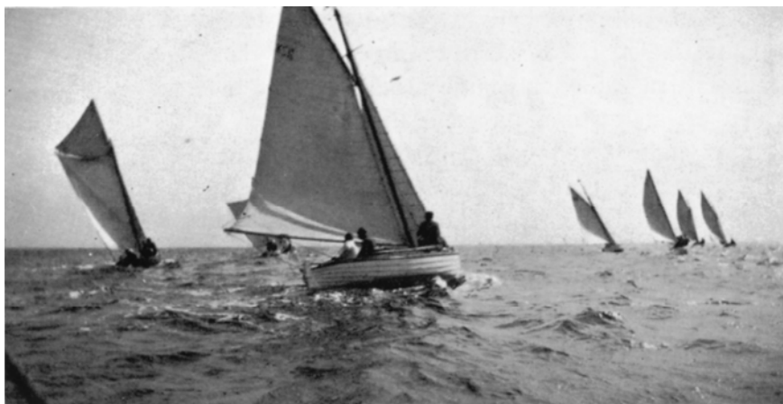
Første og anden start er gået.

og ligeledes var præmietagernes navne gengangere, som de er det i dag.