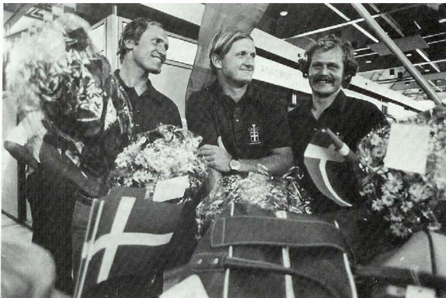
OL guldvindere i Soling 1976 og 1980: Poul R. Høj Jensen, Valdemar Bandolowski, Erik Hansen.

Det var således en periode med stor aktivitet på det sportslige område, og kronen på værket må nok siges at være de 2 olympiske guldmedaljer, som klubmedlemmerne Valdemar Bandolowski og Erik Hansen var med til at vinde sammen med Poul Richard Høj Jensen i Soling i 1976 og 1980, et resultat de afsluttede med et VM i 1984.