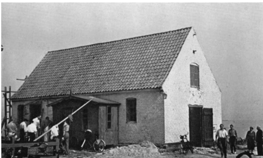
Greisens pakhus 1949 før ombygningen.

Der anskaffedes et elektrisk spil til beddingen, hvilket i høj grad lettede arbejdet med optagning af fartøjerne. En længe savnet mastekran