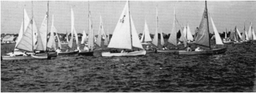
Fra fællessejladsen ud for Dragør 14. sept. 1949.

roret«, og hvor han - når man svedige af at mase - nåede tæt ved målstregen, skød sejladsen af. Det var vel nok for at placere sig, at der blev sejlet, men det var minsandten også for at more sig.