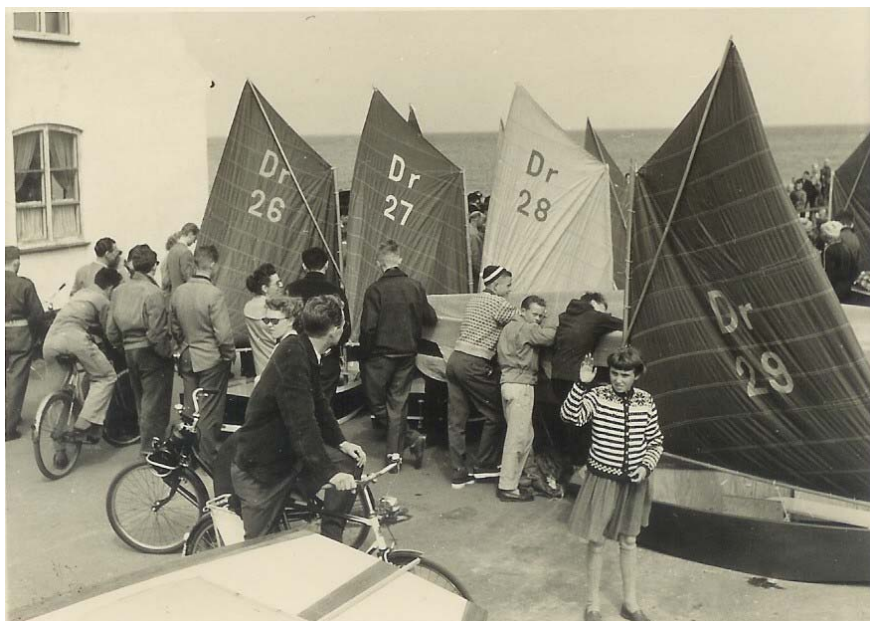
7 optimistjoller døbes i 1954.

Det var et stort øjeblik, da jollerne efter flere officielle taler blev sat i vandet, og bygmestrene tog den første sejltur, men det viste sig snart, at eet var at bygge en jolle, noget andet at føre den, og det var denne