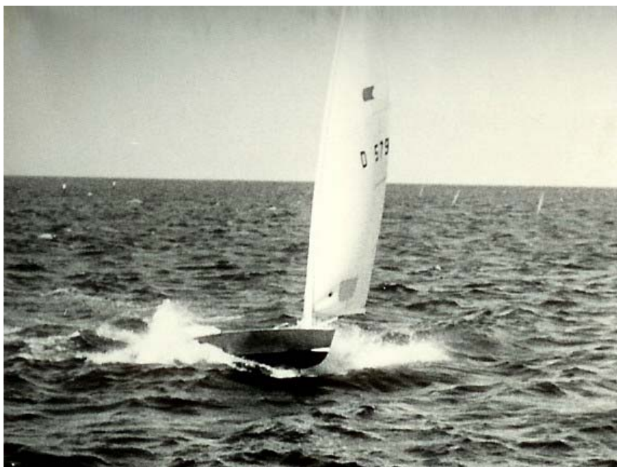
Planende Ok-jolle i perfekt balance, nord for havnen under land.

Og man må indrømme, at det vejræssige held ikke rigtig var med pionererne i starten. Man erindrer nogle af de første starter, hvor det blæste med meget kraftig vindstyrke, så dommerne ikke turde lade jollerne sejle på den almindelige jollebane, men lod dem sejle i området nord for havnen under land, og hvor de fleste af dem væltede - selvfølgelig til stor morskab for »spåmændene«. En senere landskendt O.K.-jollesejler stod på det flade vand helt inde ved stenkanten ved