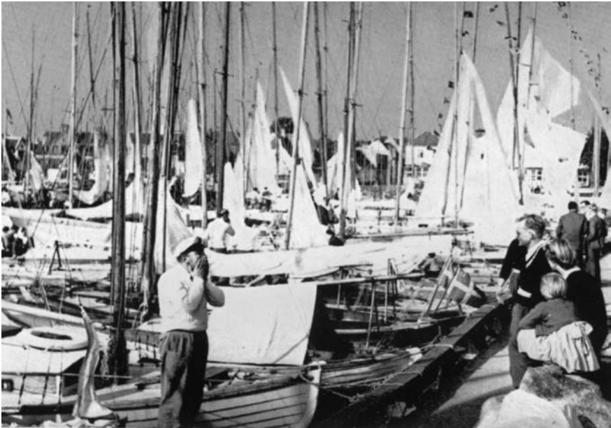
Trængsel af fartøjer i havnen ved en fællessejlad.

pladsen. Der dukkede mange gode juniorsejlere op, og der blev hentet mange præmier hjem fra udenbys sejladser. Vi gjorde os gældende ved danmarksmesterskaberne, blev udtaget til verdensmesterskabssejladser og til nordiske mesterskaber o. m. a. Det ville føre for vidt at nævne navne. Der står i dag respekt om Dragør Sejlklubs juniorsejlere over hele landet.