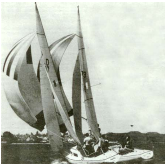
Billedet viser en skarp og meget tæt duelsejlad ud for Dragør i 1979. Sejladsen fandt sted 2. Pinsedag. Duelsejladserne var den spæde opstart til det, der i dag kaldes matchrace.