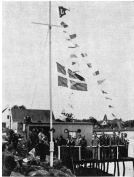
Fartøjsstationen i 1924 og standerhejsning ved det gamle klubhus.