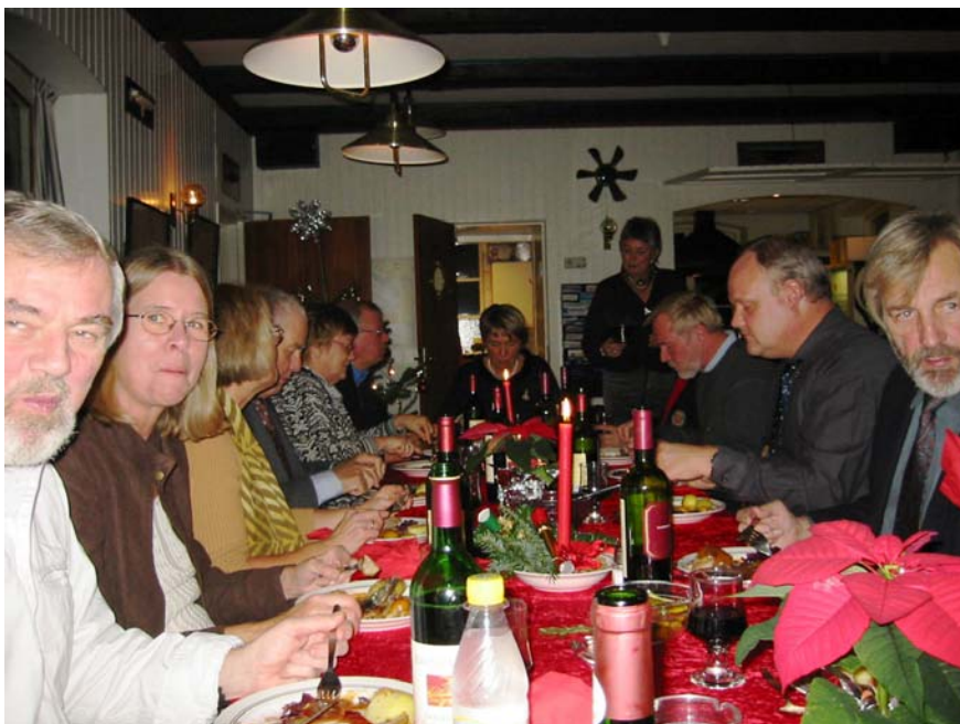
Klublivet blomstrer, både i og uden for sæsonen!