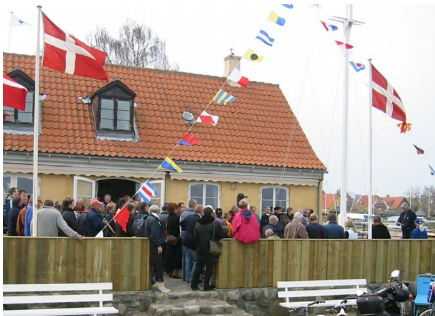
Indvielsen af den nyrenoverede Madsens Krog i 2005.

Den 6. maj 2005 blev der døbt 50 nye optimistjoller i champagne. Efter dåben blev de udleveret til 10 sejlkubber, efter en ny model. Modellen, der er en kombination af sponsorbidrag, finansiering og stor-