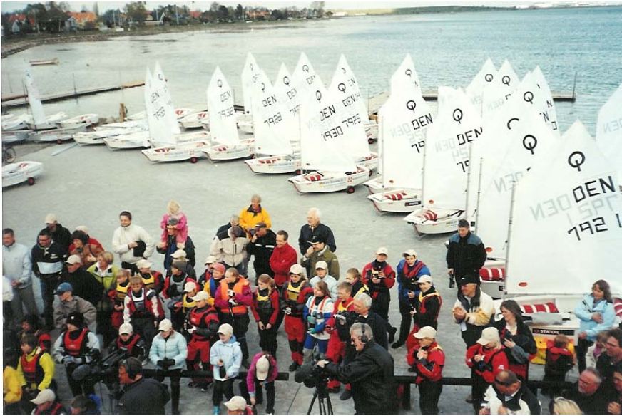
50 nye optimistjoller døbes i champagne.